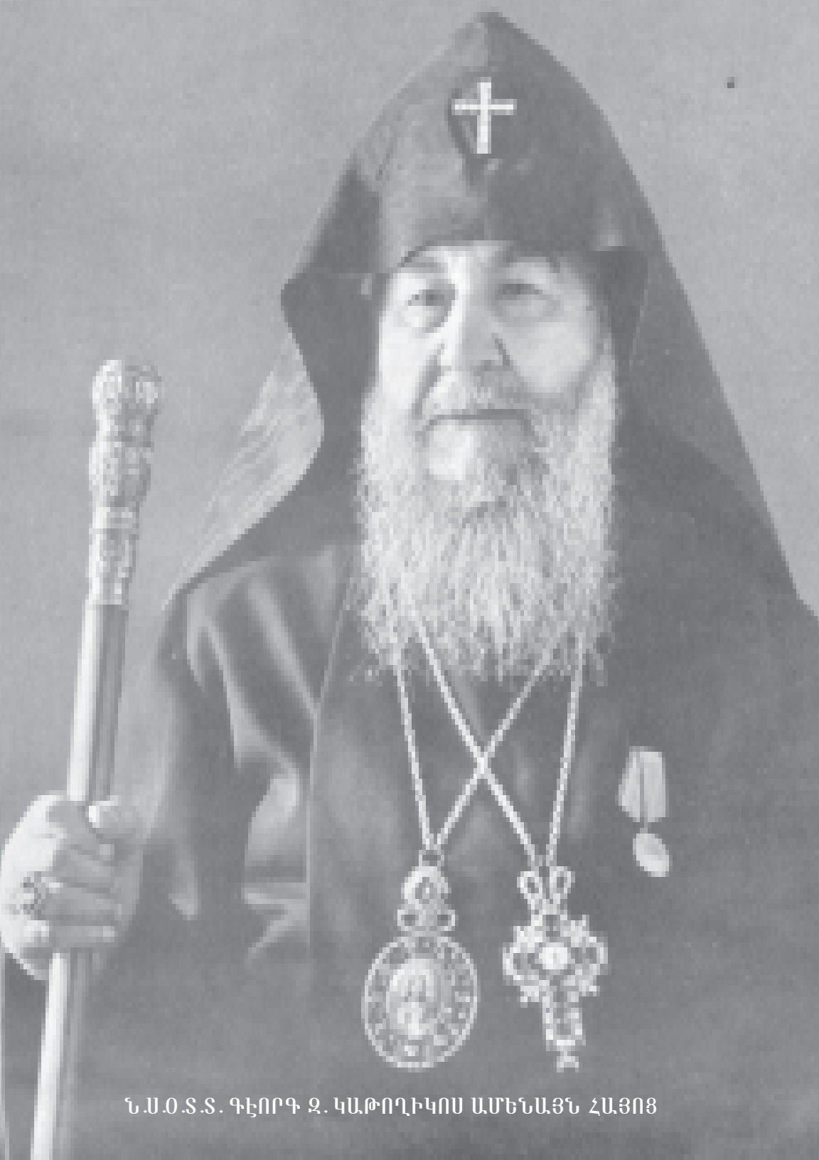
Ն.Ս.Օ.Տ.Տ. ԳԵՆՐԳ Զ. ԿԱԹՈՂԻԿՈՍ ԱՄԵՆԱՅՆ ՀԱՅՈՑ