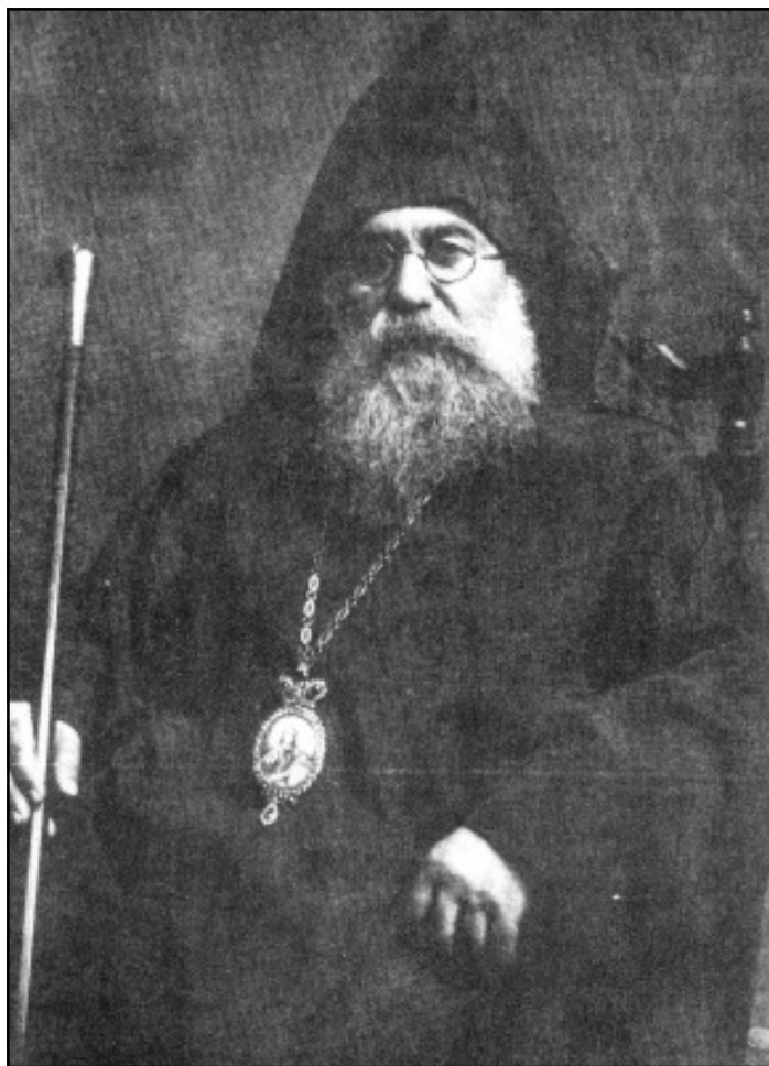
Տ. Բարգէն Ա. Կիլիկեցիական 1868 - 1936