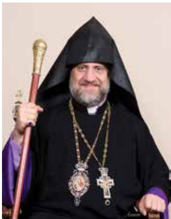
ԲԱԲԳԵՆ ԱՐՔԵՊԻՍԿՈՊՈՍ Առաջնորդ՝ Գանատայի Հայոց Թեմին

Մարդուն մեծագոյն թերութիւններէն մէկն է ինքզինք արդարացնելու համար ուրիշը նուաստացնելը՝ զրպարտութեամբ եւ բամբասանքով: Յաճախ մարդիկ ուրիշներուն թերութիւնները կ'ուզեն գտնել եւ քննարկման առարկայ դարձնել բամբասանքով, նոյնիսկ եթէ այդ թերութիւնը կրկնակի կամ եռակի չափով իրենց մէջ գոյութիւն ունենայ: