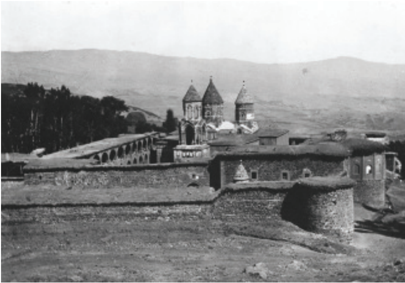
St Karapet monastery of Mush, in Taron Region, before its destruction