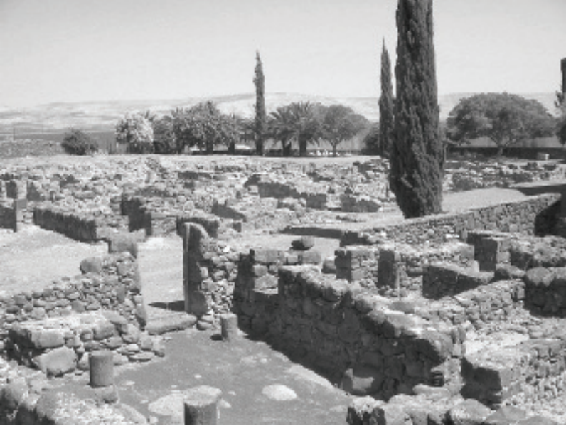
Կափառնաումի ամերակները այսօր

սուս, երբ Բեթսայիդայի մէջ հաւաքուած ամբոյսը կոչեց «ոչխարք որոց ոչ իցէ հովիւ»: