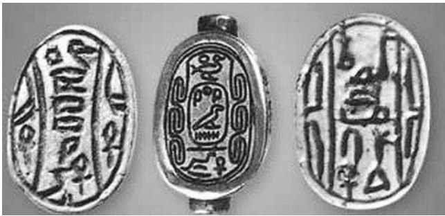
Հիքսոս արքայական կնիքներ