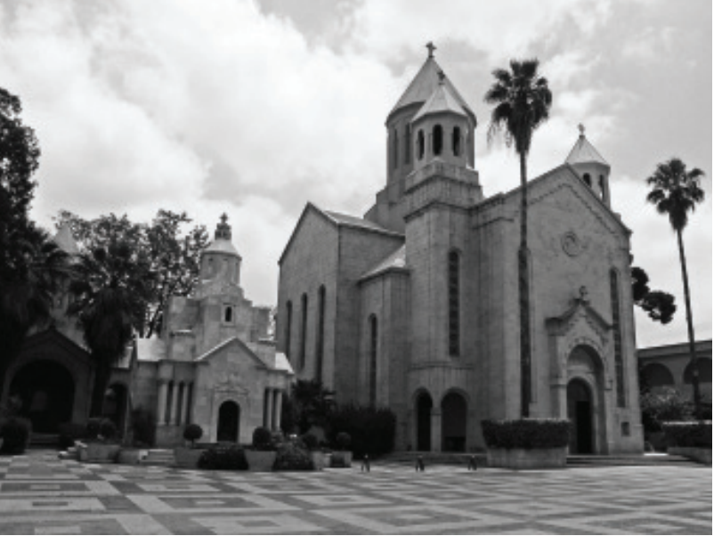
St. Gregory the Illuminator Cathedral in Antelias, Lebanon