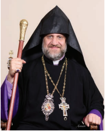
ԲԱԲԳԷՆ ԱՐԹԵՊԻՍԿՈՊՈՍ Առաջնորդ՝ Գանատայի Հայոց Թեմի