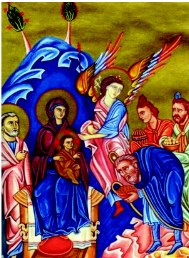
«ՄՈԳԵՐՈՒ ԳԱԼՈՒՍԸ» Ժամանակակից ստեղծագործություն